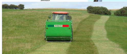
Tereny sportowe, parki, zieleńce...